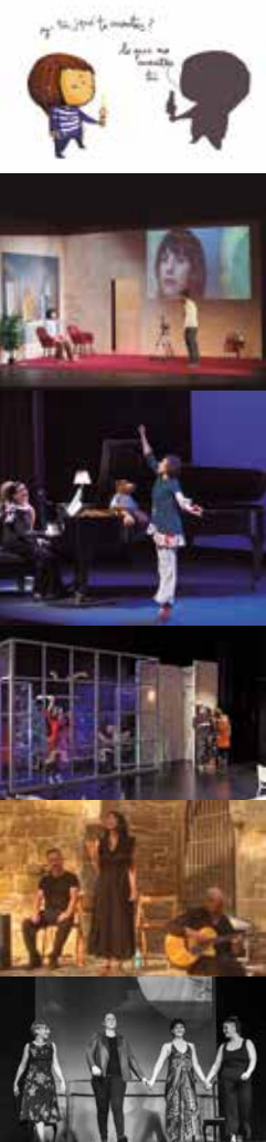
Imagen de portada: ilustración de Myriam Cameros.